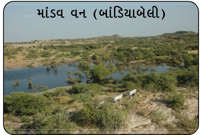
માંડવ વન (બાંડિયાબેલી)