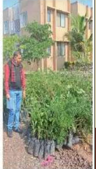
ઈનોવેશન ફેસ્ટિવલમાં પર્યાવરણ જાળવવા માટે વૃક્ષોના રોપા વિતરણ કરવા.

સુરેન્દ્રનગર જિલ્લા શિક્ષણ તાલીમ ભવન દ્વારા જિલ્લા કક્ષાના ઈનોવેશન ફેસ્ટિવલમાં વિભાગીય ખાતે આયોજન કરવાનું હતું, જેમાં 30થી વધુ ઈનોવેશન વિદ્યાર્થીઓએ કૃતિ રજૂ કરી હતી. આ વર્ષે જિલ્લાકક્ષાના ઈનોવેશનમાં 1000 વૃક્ષોનું વિતરણ કરવાનું આયોજન કરવામાં આવ્યું હતું. જિલ્લાકક્ષાના ઈનોવેશન ફેસ્ટિવલમાં આયોજન કરવામાં આવ્યું હતું, જેમાં પ્રકૃતિકર્મ, આયોજિત કરેલા શિક્ષણ, ઈનોવેશન કાર્ટ, વગેરે જે કોઈ કોઈના આધારે વિદ્યાર્થીઓએ તૈયાર કર્યા હતા તે વર્ષ પછી ઈનોવેશન ફેસ્ટિવલમાં આયોજન કરવામાં આવશે. જે. ડી. આર.નાથના આધારે શિક્ષણ તાલીમ ભવન દ્વારા આ વર્ષે પછી ઈનોવેશન ફેસ્ટિવલમાં આયોજન કરવામાં આવશે. જે. ડી. આર.નાથના આધારે શિક્ષણ તાલીમ ભવન દ્વારા આ વર્ષે પછી ઈનોવેશન ફેસ્ટિવલમાં આયોજન કરવામાં આવશે.