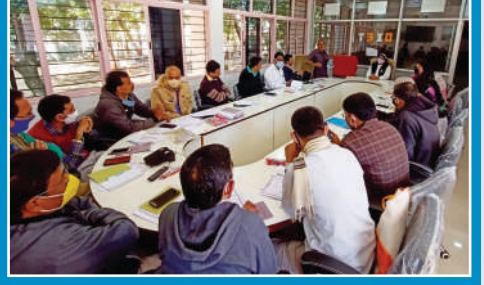
ભગવદ્ ગો મંડળ અને દલપત ગ્રંથાપલિની સમીક્ષા